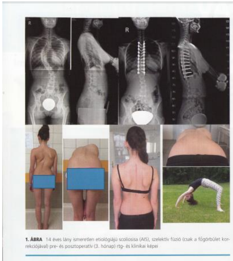
1. ÁBRA 14 éves lány ismeretlen etiológiájú scoliosisa (AIS), szelektív fúzió (csak a főgörbület korrekciójával) pre- és posztoperatív (3. hónap) rtg- és klinikai képei

A műtét után: a páciens szükség szerint intenzív osztályra, vagy postoperatív őrző kórterembe kerül megfigyelésre és ápolásra. A fájdalmak csillapítása, a keringési és légzési rendszer stabilizálása céljából hosszabb-rövidebb ideig szükség lehet a gépi lélegeztetés további fenntartására, a megfelelő nyugtató és altató hatású gyógyszerek alkalmazása mellett. A gyógytornát – lehetőség szerint – már az intenzív osztályon megkezdjük. Az egy lépcsőben végrehajtott korrekciós műtétet követően általában 1-2 nappal a beavatkozás után gyógytornász segítségével megkezdődik a páciens mobilizálása, amelyet az intenzív osztályos megfigyelés és kezelés után az osztályon folytatunk. Varratszedés a műtét után 12-15 nappal történik. Az első kontroll vizsgálat a műtét után három hónappal esedékes.